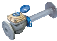
電子式水道メーター ET(V)W