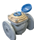
電子式水道メーター EATW