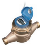
電子式水道メーター EDS