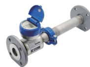
電磁式水道メーター SU-KV