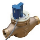
マルチリード式水道メーター DN