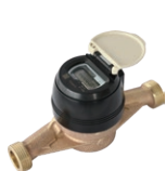
電子式水道メーター ER